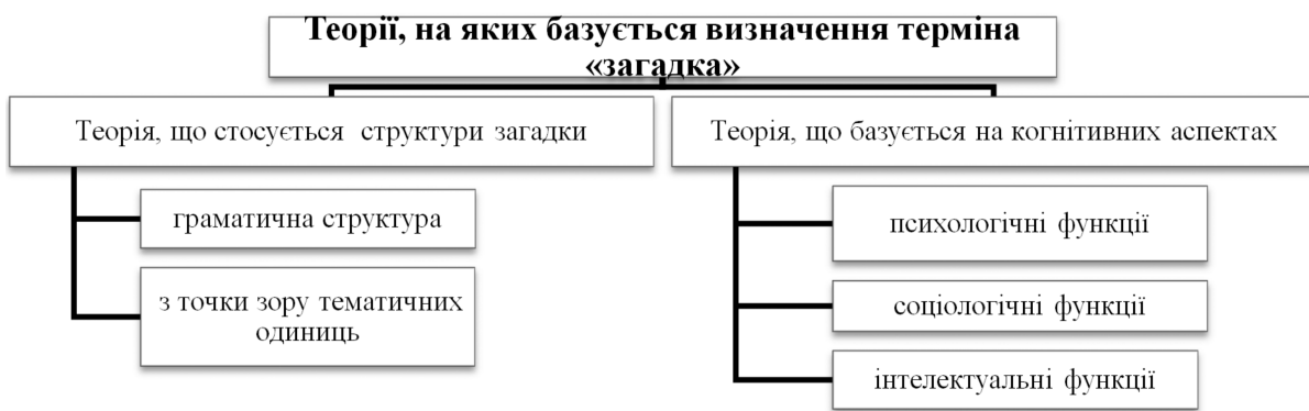
Рис. 1. Теорії, на яких базується визначення терміна «загадка» (складено автором на основі [7]).

Як зазначають Т.А. Green та W.J. Pepicello, визначення загадки базується, в основному, на двох теоріях (рис. 1).